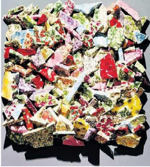
Burçak Bingöl'ün 'Hayalkırıklığı II' eseri.