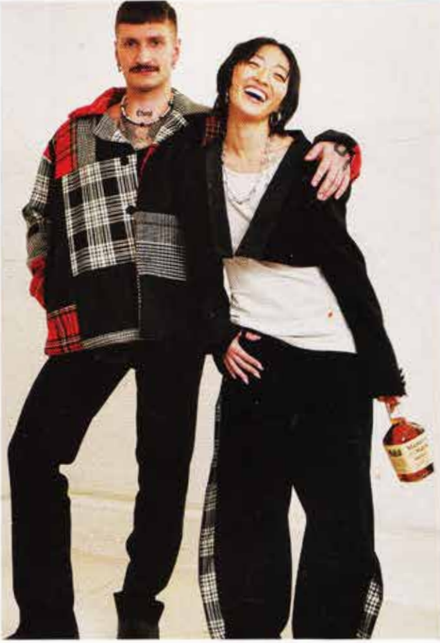
Tasarımcılarla yapılan iş birlikleri içki endüstrisine renk ve stil katıyor.