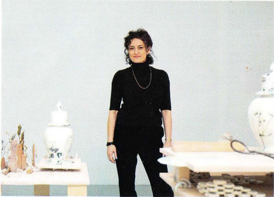
Bingöl, yaşam deneyimlerine ilişkin hesaplaşmalarıyla Ankara'ya geri geliyor; bir döngüyü kapatmak için.

• Yeryüzündeki Minör Titreşimler , 7 Ekim-18 Kasım tarihleri arasında Ka Atölye'de görülebilir.